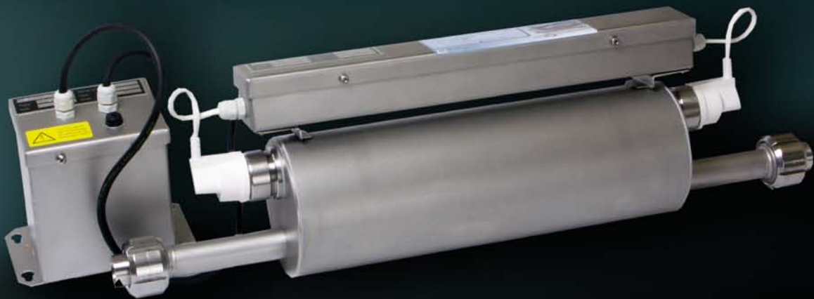
Type : RVS 5001 SP / D-Pro